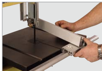
Battuta longitudinale di precisione con lente di ingrandimento regolabile dall'alto