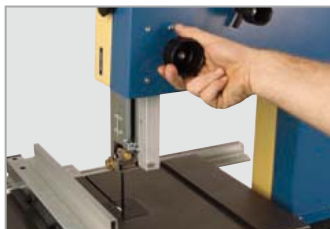
Regolazione altezza taglio mediante volantino