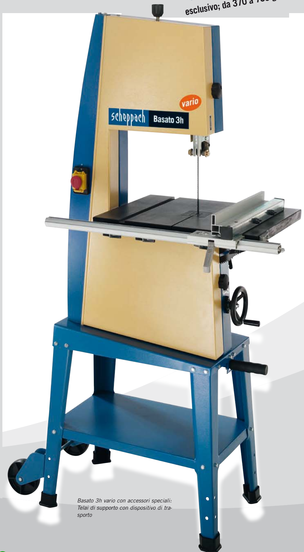
Basato 3h vario con accessori speciali: Telai di supporto con dispositivo di trasporto