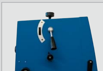
Sistema di serraggio rapido per un veloce cambio della lama