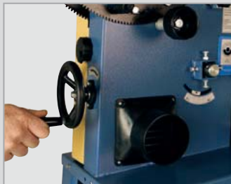
Esclusivo vario-drive regolabile in continuo mediante apposito volantino

Vario-drive esclusivo; da 370 a 750 giri/min