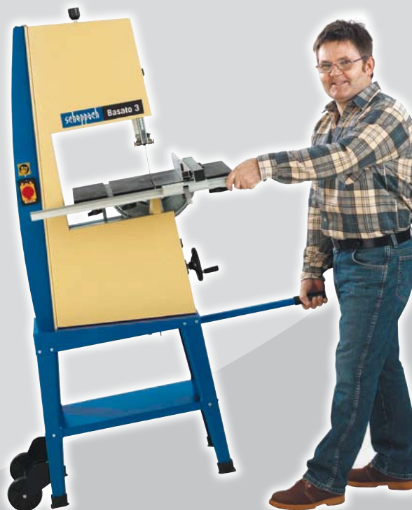
La figura illustra accessori speciali soggetti a sovrapprezzo

Nastri abrasivi, set 3 pezzi cad. K 60 Codice ordine 7319 0711 K 120 Codice ordine 7319 0712