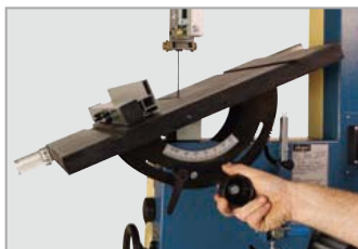
Regolazione piano mediante volantino possibile anche con una sola mano