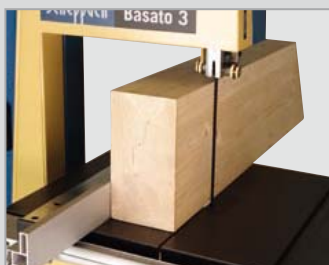
Esclusiva altezza luce di 205 mm e larghezza luce di 306 mm