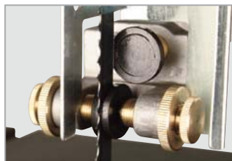
Guida di precisione a 3 rulli indurita, sopra e sotto il piano di lavoro