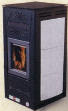
Sale e Pepe

Poiché l'azienda è costantemente impegnata nel continuo perfezionamento di tutta la sua produzione, le caratteristiche estetiche e dimensionali, dati tecnici, gli equipaggiamenti e gli accessori, i colori, possono essere soggetti a variazione.